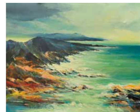
Petar Lazarevič V Istri akril na platnu, 2023, 80 x 100 cm