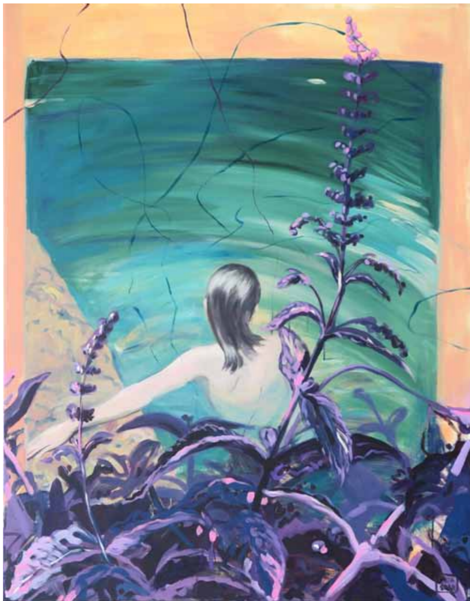
Meta ŠOLAR Menta piperita akril na platnu, 2023, 130 x 100 cm