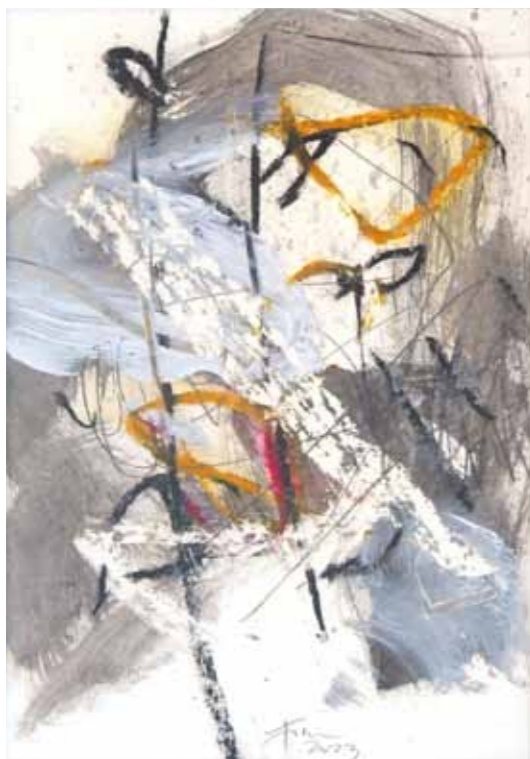
Črtomir Frelj Šopek mešana tehnika na papirju, 2023, 33 x 50 cm