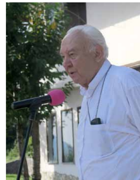
Spodbudne besede škofa Jurija Bizjaka