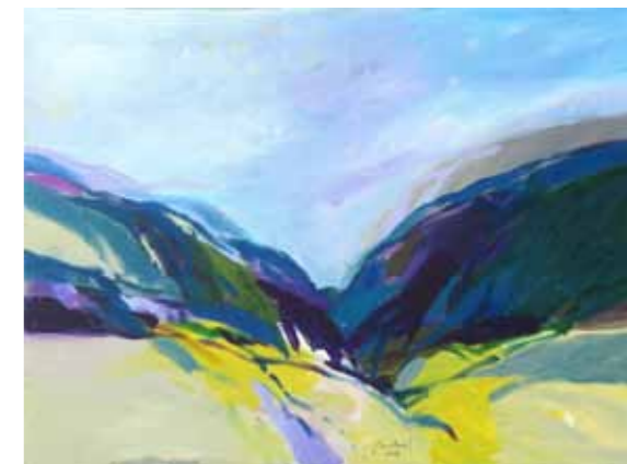
Lucijan BRATUŽ SV 02 akril na platnu, 2023, 40 x 50 cm