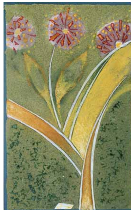
Herman LASZLO Konec poletja Fuzija na platnu, 2023, 70 X 40 cm