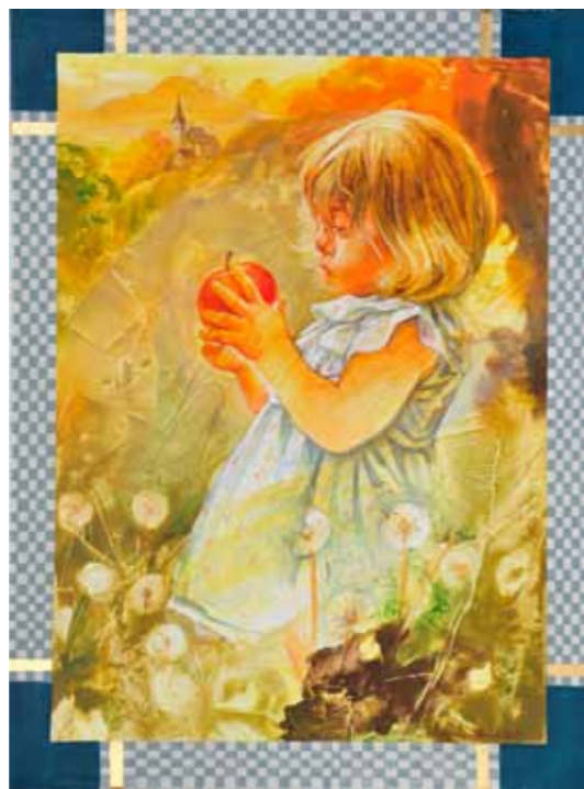
Maša Bersan Mašuk Eva akril na platnu, 2023, 80 x 60 cm