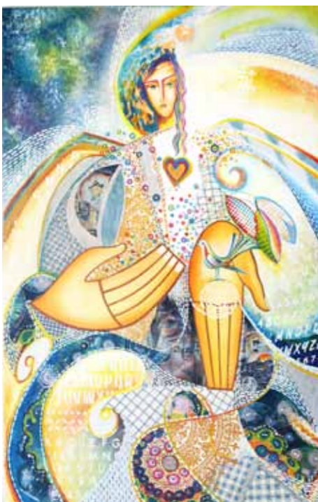
Severina Trošt Šprogar Mir v tej hiši mešana tehnika, 2023, 110 x 70 cm