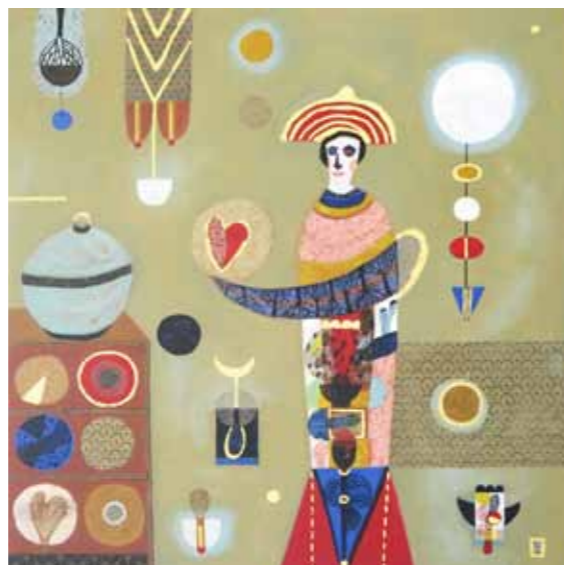
Lona VERLICH In his Hands akril na platnu, 2023, 70 x 70 cm