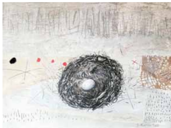
Silva KARIM Srebrna tišina akril na platnu, 2023, 40 x 50 cm