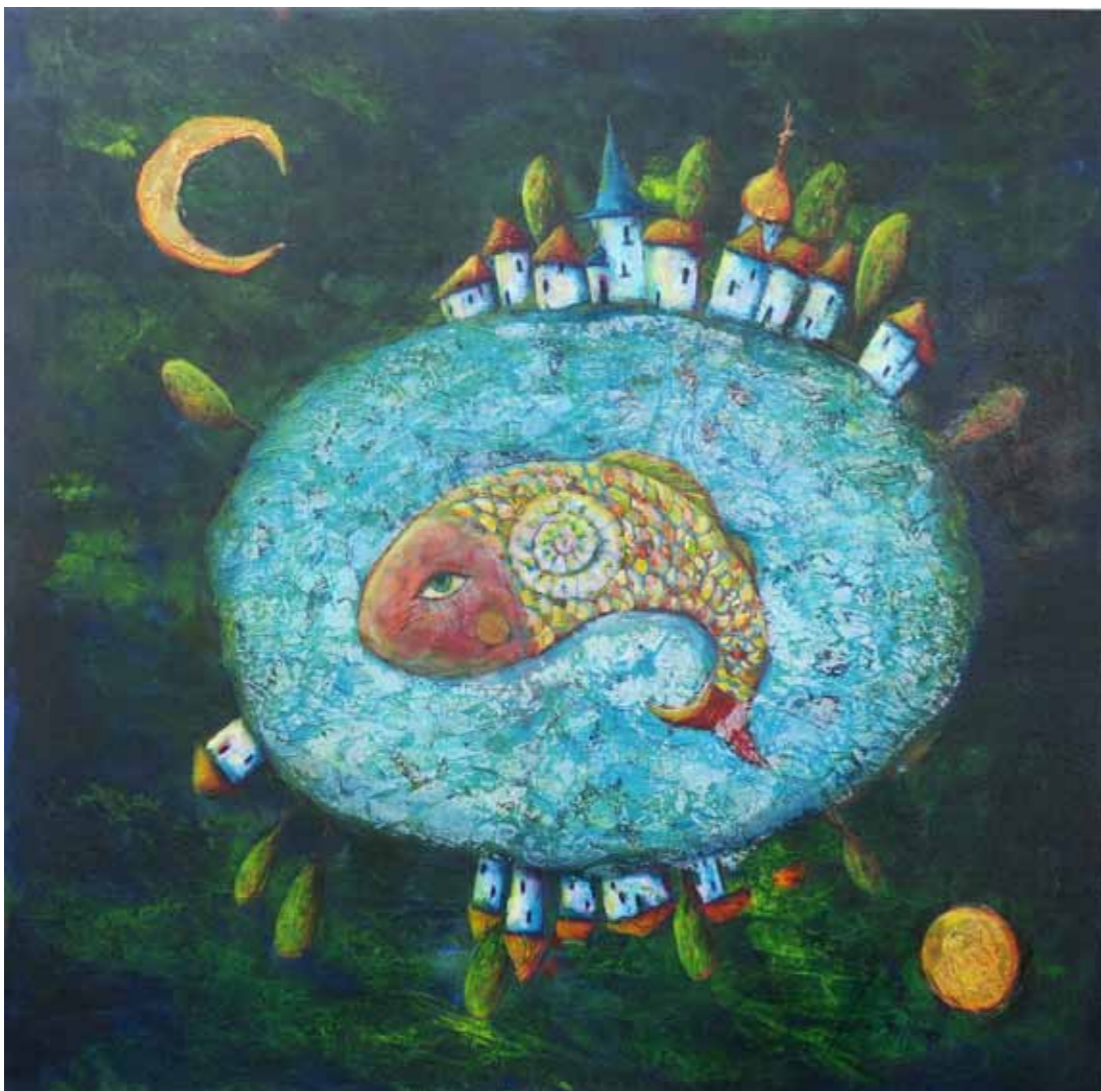
Natalia BEREZINA Večerna sapica akril na platnu, 2023, 40 x 50 cm