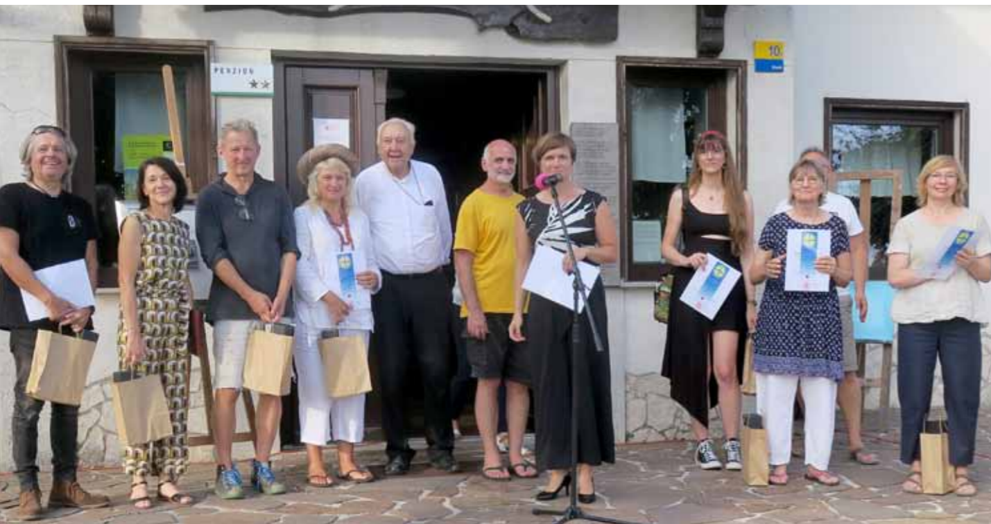
Skupina ustvarjalcev ob zaključku letošnje kolonije