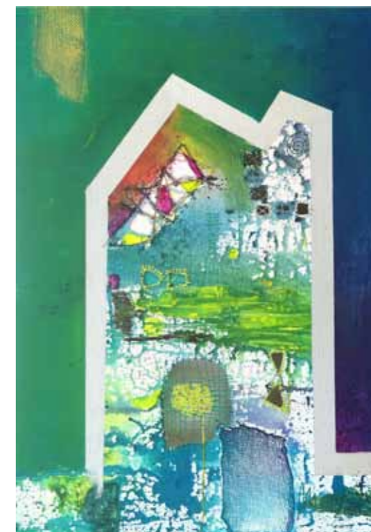
Mira RESNIK Hiša dobrih vzorcev 2 akril na platnu, 2023, 70 x 50 cm