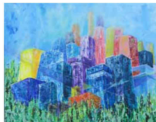
Igor Zimic Mir v tej hiši akril na platnu, 2023, 100 x 130 cm