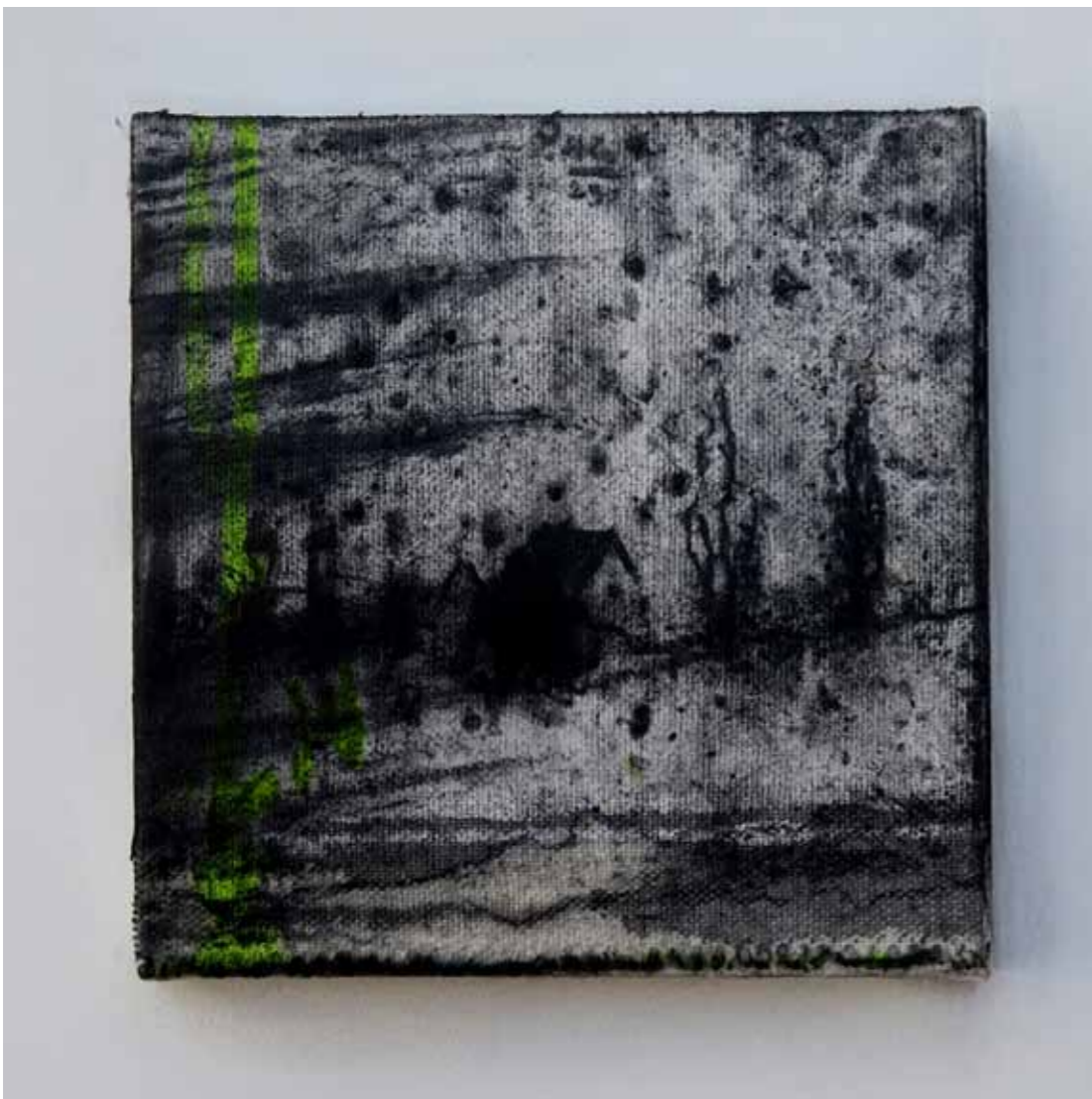
Herman GWARDJANČIČ Spomin na Kras mešana tehnika, 2023, 15 x 15 cm