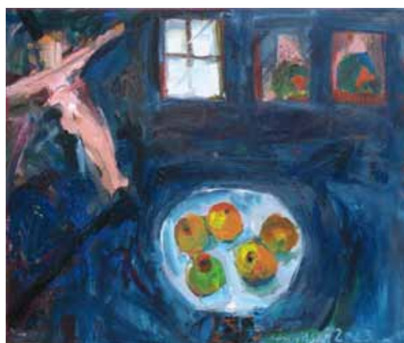
Veljko Toman Mir v hiši akril na platnu, 2023, 75 x 90 cm