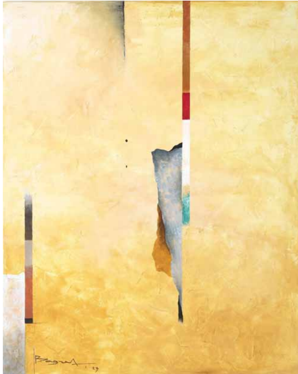
Bagrat ARAZYAN Up and Down akril, olje na platnu, 2023, 100 x 80 cm