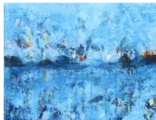
Azad KARIM Dežela upanja akril na platnu, 2023, 40 x 50 cm