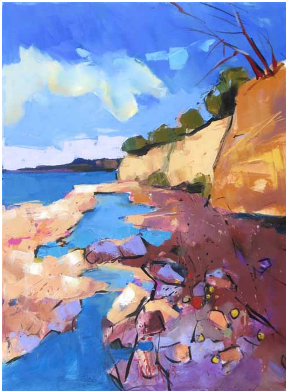
Pavle ŠČURK Klifi Debeli rtič olje na platnu, 2023, 80 x 60 cm