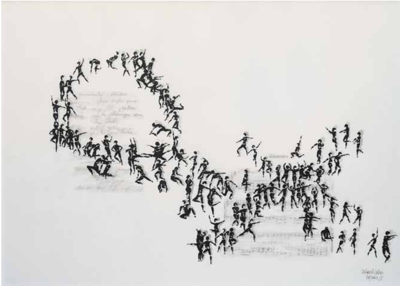
Nuša DUPALO - LOSS Biti ves iz sebe, Hommage an France Prešeren I. - Zdravljica tuš na papirju, 2023, 76 x 56,5