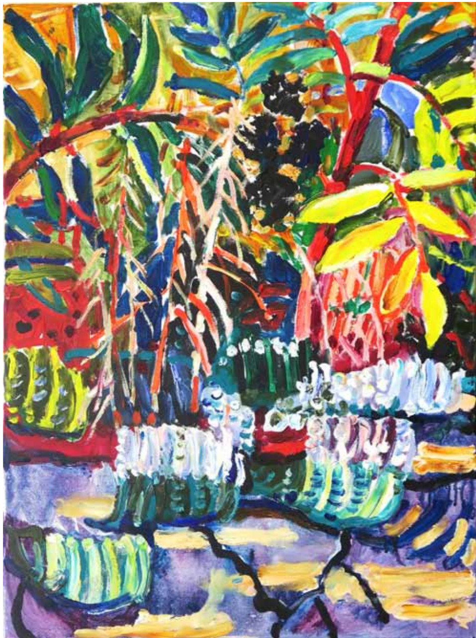
Svitlana LYASHXHUK - LEBIGA Gorske trave olje na platnu, 2023, 80 x 60 cm