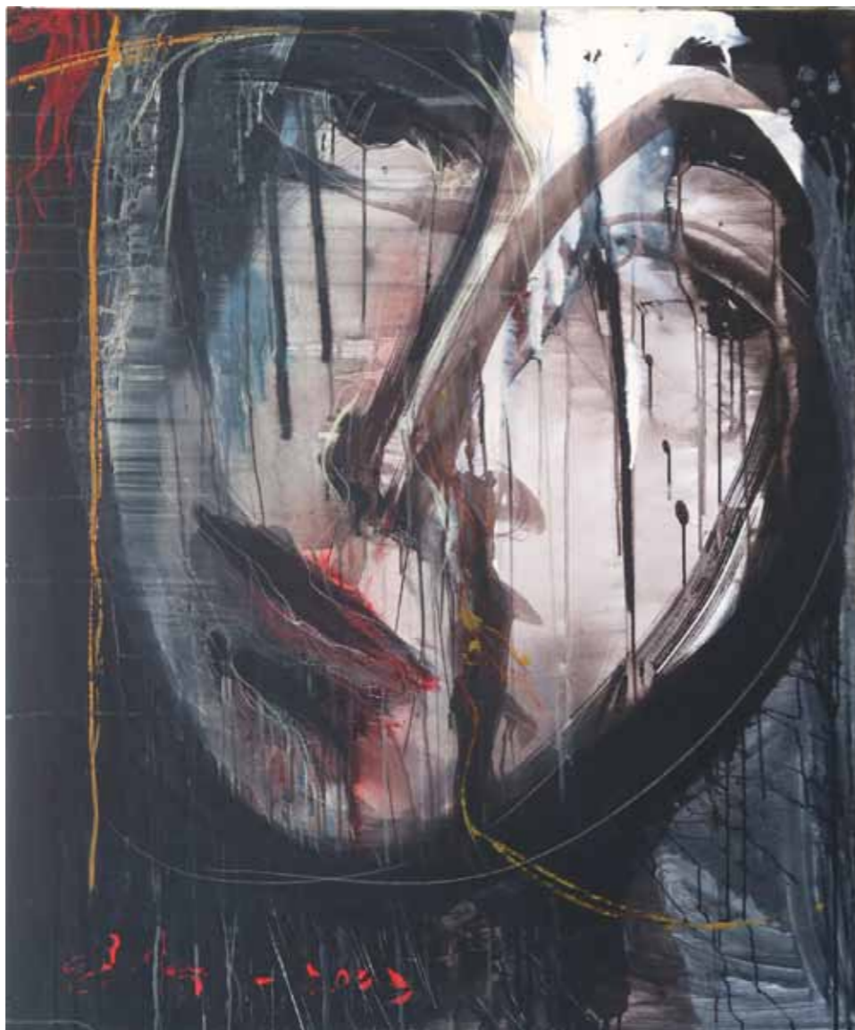
Eduard BELSKY Madonna akril na platnu, 2023, 130 x 100 cm