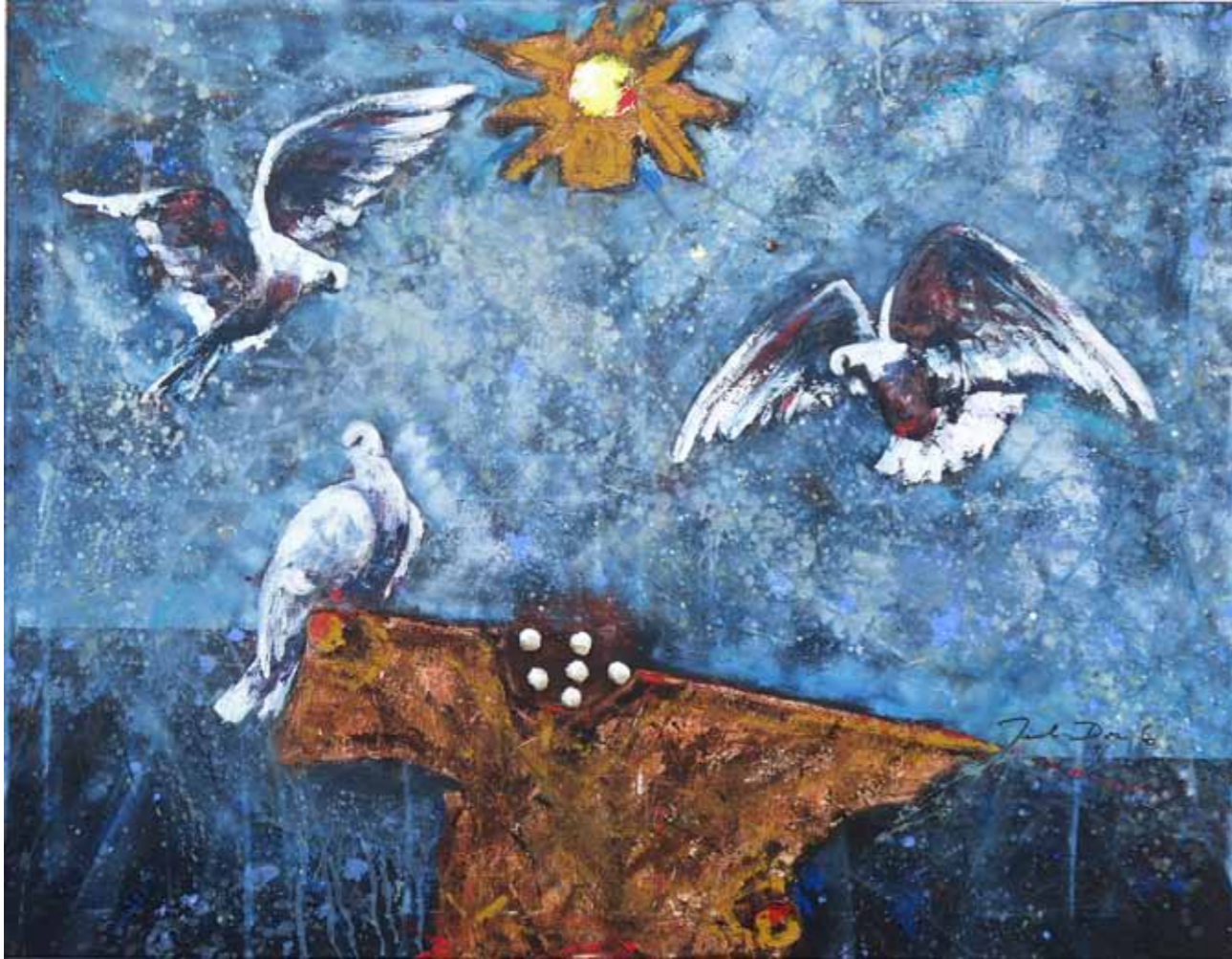
Danilo JEREB Jutranji ples akril na platnu, 2023, 100 x 130 cm