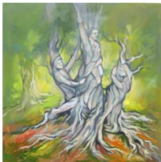
Janez KOVAČIČ Božje drevo olje na platnu, 2023, 80 x 80 cm