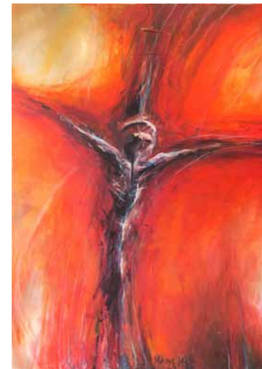
Miloš MARC Kristus akril na platnu, 2023, 100 x 70 cm