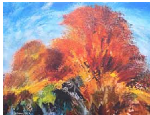
Bogdan Soban Rojstvo svetlobe digitalni tisk na platno, 2022, 80 x 60 cm