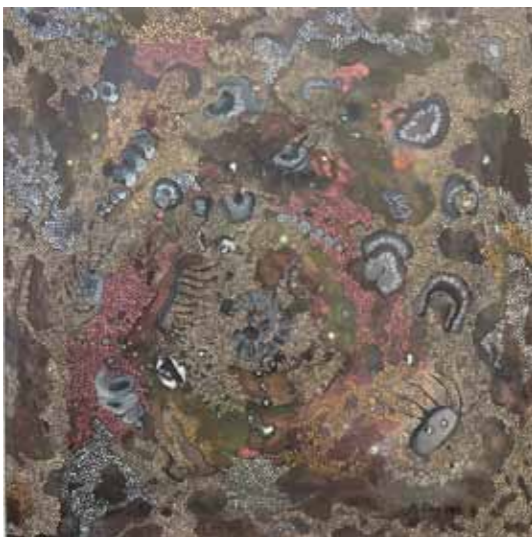
Tatjana Mijatovič Okamenki akril na platnu, 2023, 60 x 60 cm