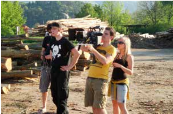
Neskončni voz – snemanje