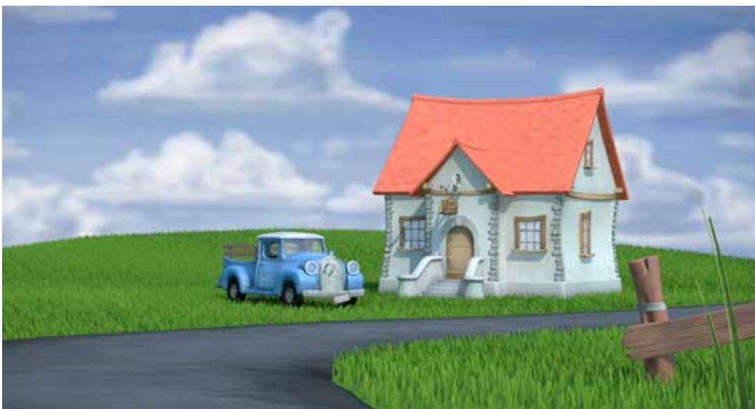
Last Lunch screenshot 5