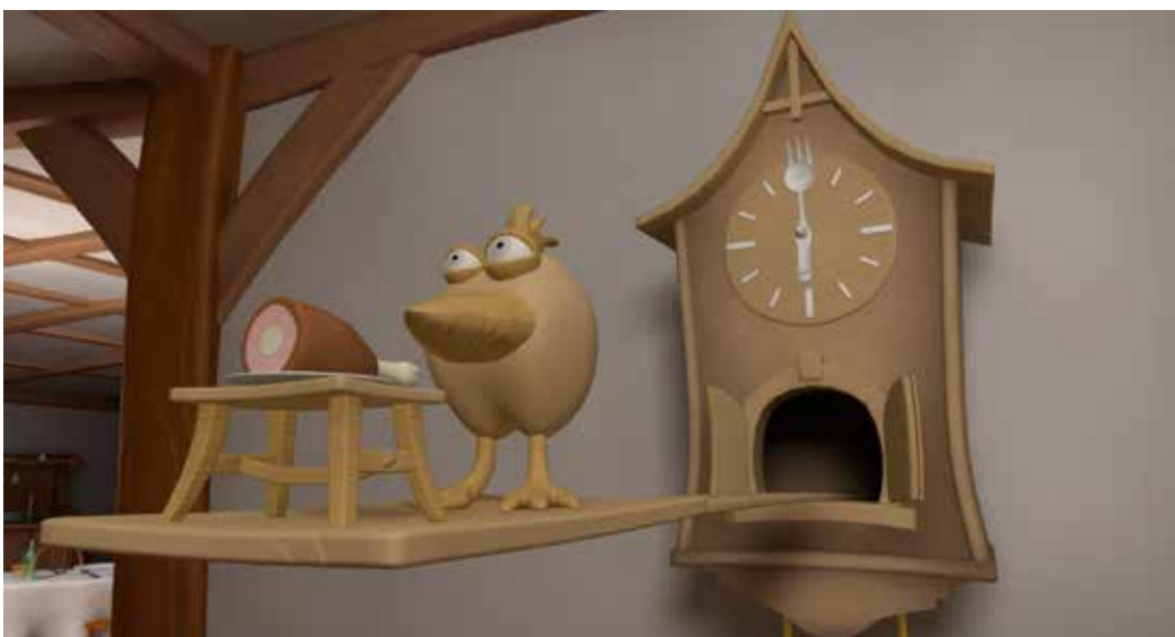
Last Lunch screenshot 1