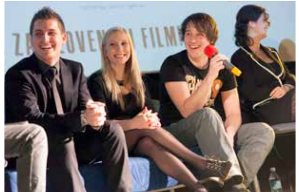
Premiera – Missing the moment

Fajn mi je bilo celi čas študija. Zanimivo mi je bilo recimo to, ker smo imeli računalniško učilnico v kleti in dostikrat se je zgodilo, da sem prebil cele večere sam v njej in risal animacije, dokler me ni vratar vrgel ven ob 10h zvečer. Najbolj zanimivo, kar nikoli ne bom pozabil je bilo tudi to, da ko sem delal diplomsko animacijo in mi je moj mentor za 3D, ki je imel doma tudi računalniško pisarno dovolil, da sem delal pri njemu doma. Spomnim se